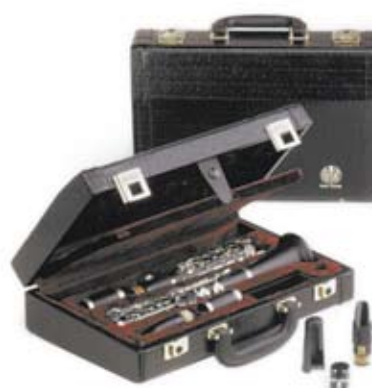
Koffer Nr. 40