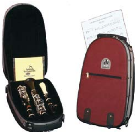
Gigbag Nr. 39